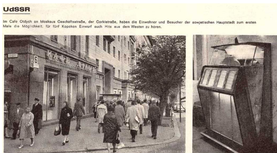
Рис. 4. Музыкальный автомат Meloman (Меломан) типа M-110 или M-120 в фотозаметке в одной из западногерманских газет 1964 года

В первой половине 70-х поляки поставляли новые "унитравские" модели: схожие между собой Fonica M-120-M [Рис. 5], Fonica M-122 [Рис. 6], Fonica M-123 [Рис. 7]. Они настолько были похожи, что русскоязычный рекламный проспект с техническими характеристиками аппаратов был общим для трёх моделей автомата. Эти музыкальные автоматы тоже разошлись по необъятным просторам Советского Союза. По инерции к ним приклеилось старое название (первой модели) – их по-прежнему называли МЕЛОМАНАми.