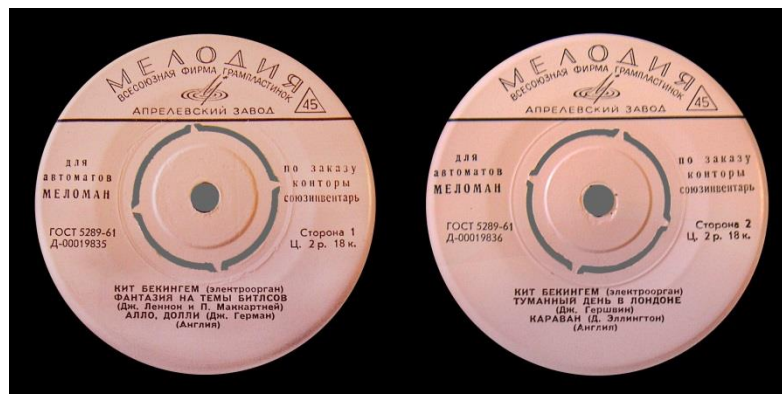
Рис. 1. Розовые этикетки миньона Д-00019835-6 на 45 об./мин.

А недавно совершенно неожиданно удалось обнаружить информацию о существовании третьей пластинки: те же четыре композиции, тоже на 7-дюймовом виниловом миньоне, опять в моно, но на 45 об./мин. с выдавливаемым центром (каталожный номер Д-00019835-6). На этикетках указано, что миньон предназначен "для автоматов МЕЛОМАН" и произведён "по заказу конторы союзинвентарь", цена нестандартная – 2 рубля 18 копеек [Рис. 1]. Выпущена пластинка была в том же 1967 году.