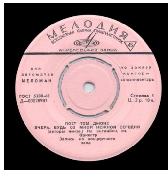
Рис. 9. Розовая этикетка стороны 1 миньона Д-00028983-4 на 45 об./мин.

К слову, первое упоминание о музыкальных автоматах "Меломан", которое удалось отыскать в центральной советской прессе, относится к 10 декабря 1966 года – в одной статье в газете "Советская культура" были такие строки: "...Зашли мы с приятелем как-то в кафе «Цирк», что на Цветном бульваре. Милое такое кафе. По углам влюблённые сидят. Славные ребята. «Меломан» играет – новомодное наше приобретение для культурного роста граждан..."