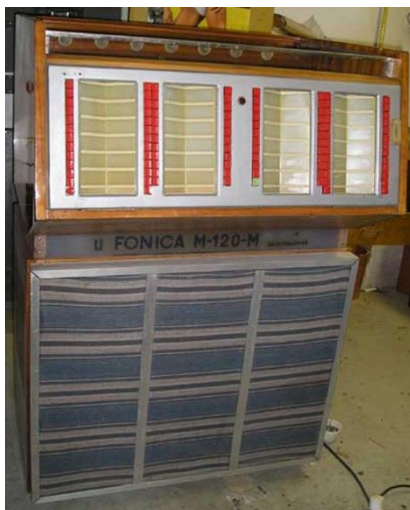
Рис. 5. Музыкальный автомат Fonica M-120-M