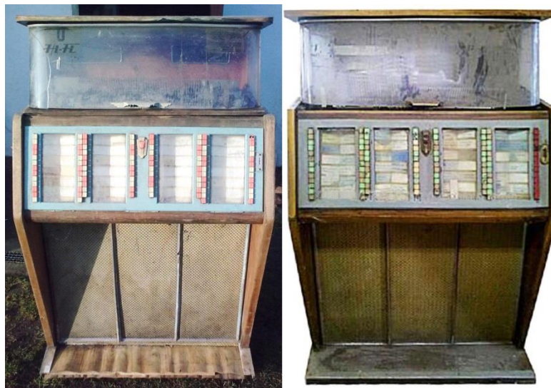
Рис. 2. Музыкальный автомат Meloman (Меломан) : тип M110 (слева) и тип M120 (справа)