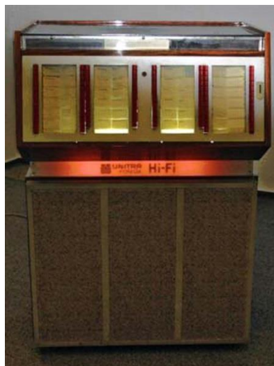
Рис. 7. Музыкальный автомат Fonica M-123

Специально для польских музыкальных автоматов фирма "Мелодия" выпускала миньоны на 45 об./мин. с центровыми вставками, которые легко удалялись – для возможности воспроизведения пластинки в музыкальном автомате. Рядовым покупателям такие пластинки были не доступны – по крайней мере, официально в магазинах они не продавались. Но, как правило, они дублировали ранее выпущенные обычные или гибкие миньоны на 33 об./мин. На сегодняшний день коллекционерам известно всего лишь около пятидесяти наименований пластинок с пометкой " для автоматов МЕЛОМАН ". Все они были выпущены Апрелевским заводом, судя по каталожным номерам, в период с 1966 по 1970 год. В 1966 году цену на этикетках не указывали, с 1967 года появилась надпись: 2 р. 18 к. Среди таких миньонов есть ещё две пластинки с битловскими каверами: на них можно услышать песни Старенький