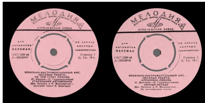
Рис. 8. Розовые этикетки миньона Д-00028947-8 на 45 об./мин.

автомобиль и Облади-облада в исполнении вокально-инструментального ансамбля "Весёлые ребята", каталожный номер мини-альбома Д-00028947-8 [Рис. 8], и песню Вчера (Yesterday) в исполнении Тома Джонса, каталожный номер этого мини-альбома Д-00028983-4 [Рис. 9]. На этикетках последней значится, что авторы Yesterday неизвестны. Оба миньона увидели свет в 1970 году и являются "дубликатами" общедоступных пластинок, выпущенных в том же 1970 году.