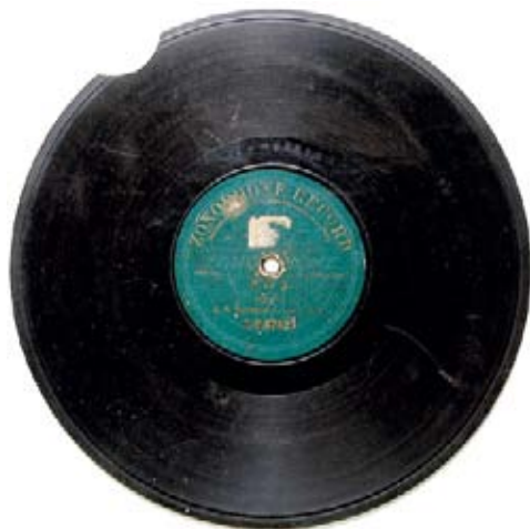
Граммофонная пластинка из архива Семёновых. На полустёртой этикетке трудно что-либо прочесть.

награды признательность благородному и великодушному учёному со стороны сотен тысяч людей, исцелённых его препаратом.