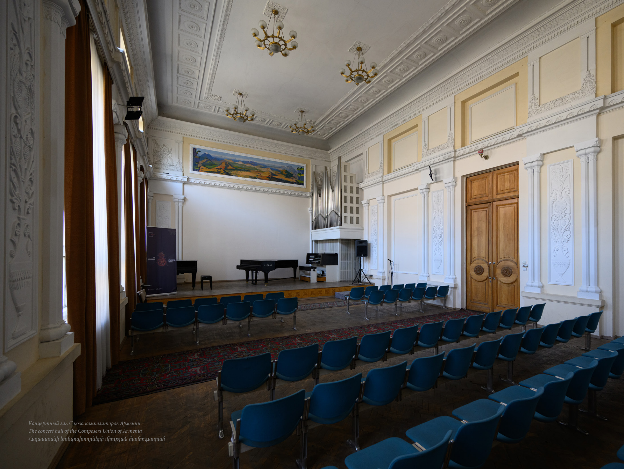
Концертный зал Союза композиторов Армении The concert hall of the Composers Union of Armenia Հայաստանի կոմպոզիտորների միության համերգասրահ