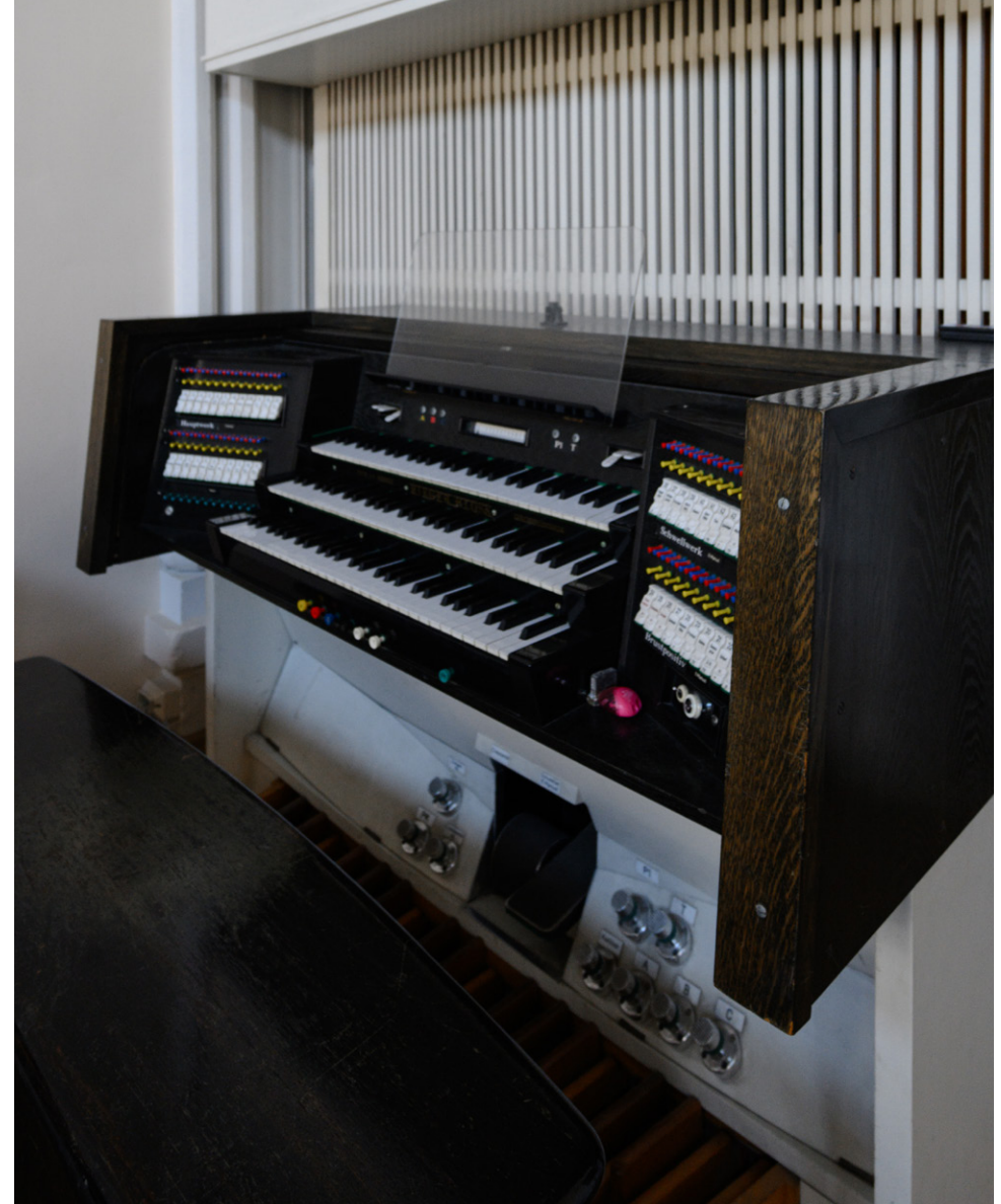
Орган фирмы Rieger-Kloss в концертном зале Союза композиторов Армении Rieger-Kloss organ in the concert hall of the Composers Union of Armenia Ռիգեր-Կլոս ֆիրմայի երգիչները Հայաստանի կոմպոզիտորների միության համերգասրահում