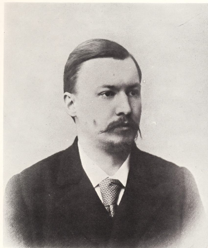
Александр Глазунов Alexander Glazunov