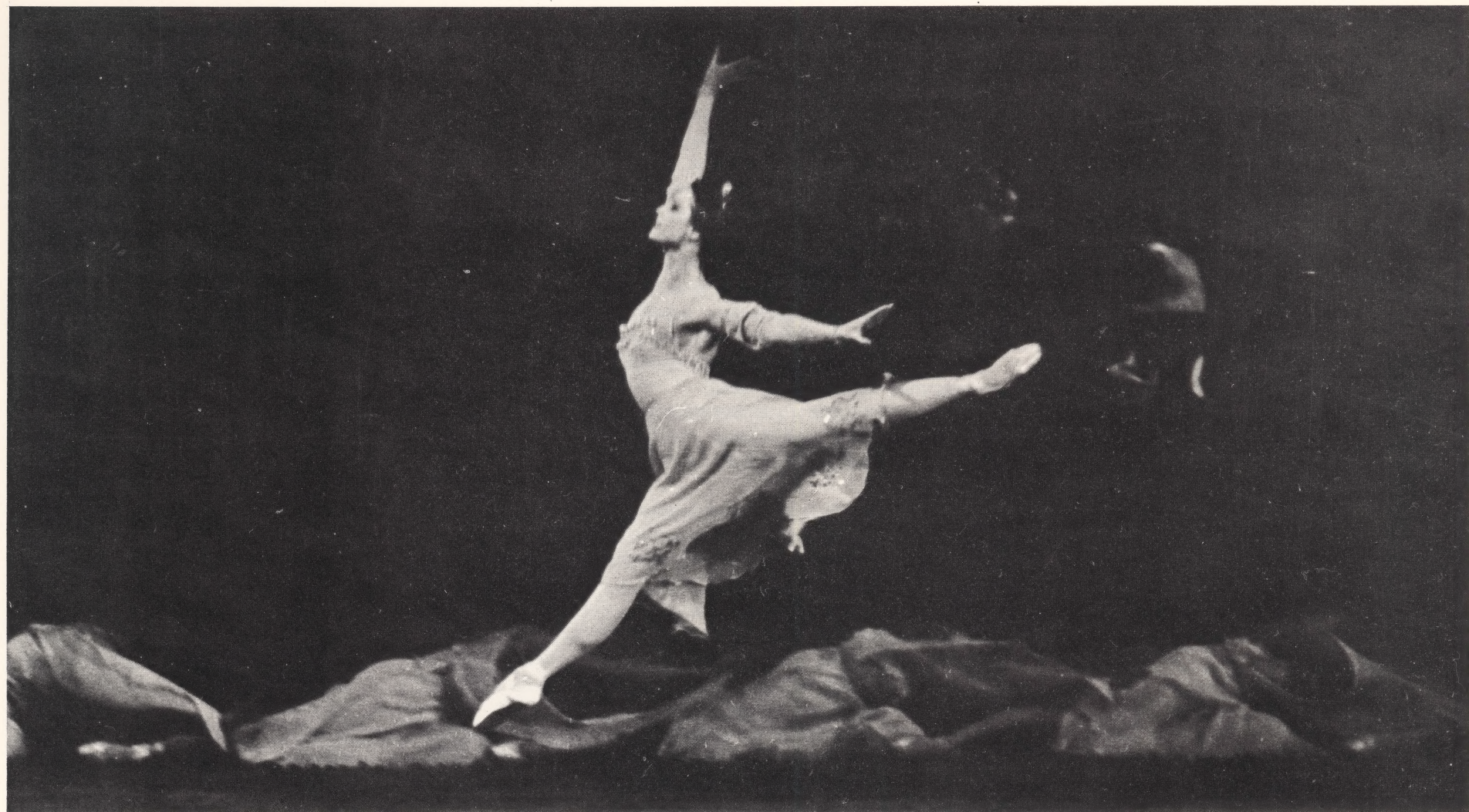
Сцена из первого действия Scene from act I

Чайковского, сказал о музыке "Раймонды", что она составляет "одно из колоссальнейших явлений русского искусства".