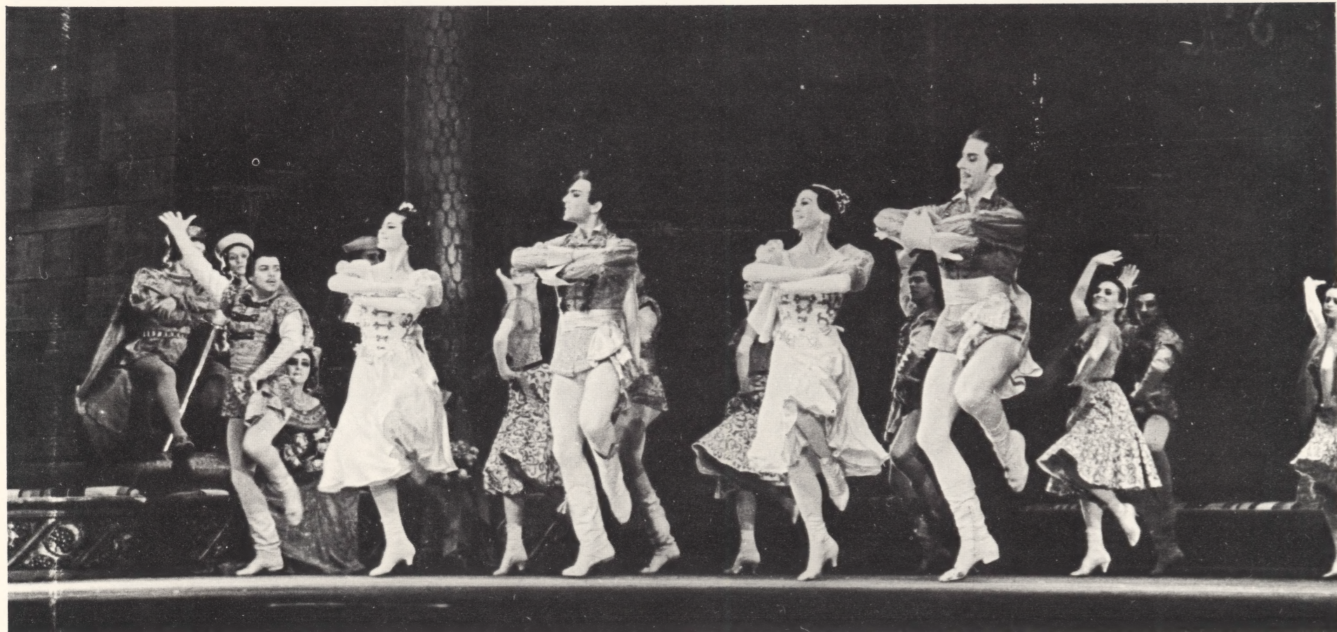
Сцена из второго действия Scene from act II

Glazounov wrote his ballet "Raymonda" in 1897, right after completing his three best symphonies—the fourth, fifth and sixth—which he composed one after the other. "Raymonda" was his first ballet. But his subtle understanding of the specific features of a genre completely new to him, and his brilliant craftsmanship immediately won for "Raymonda" a firm place on the ballet stage.