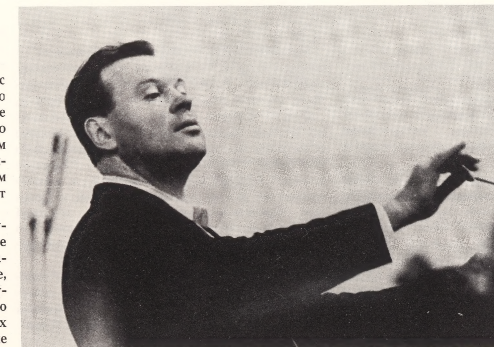
Евгений Светланов Yevgeny Svetlanov

Балетмейстер М. Петипа создал на основе музыки балета одно из замечательных классических произведений русской хореографии. Ученый и критик Г. Ларош, товарищ и друг