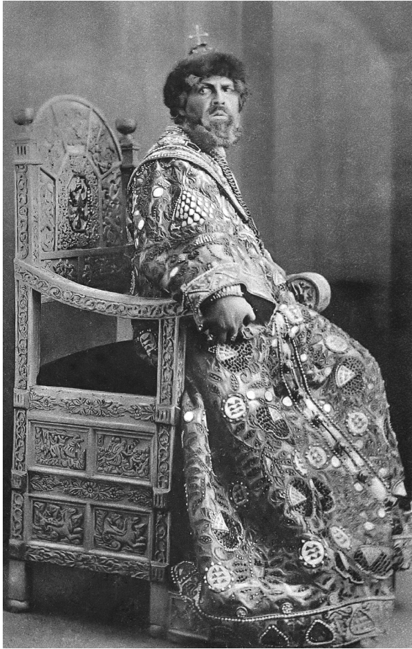
Ф.И. Шаляпин в роли Бориса Годунова