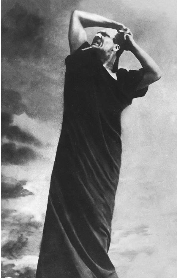
Ф.И. Шаляпин в роли Мефистофеля