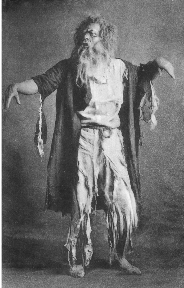
Ф.И. Шаляпин в роли Мельника