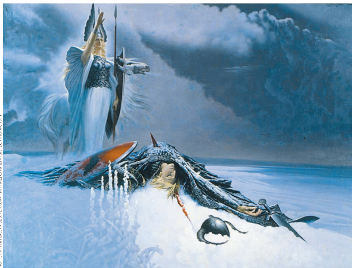
КОНСТАНТИН ВАСИЛЬЕВ. «ВАЛКИРИИ НАД СРАЖЕННЫМ ВОИНОМ». 1971