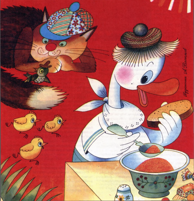
Иллюстрация А. Вассалет