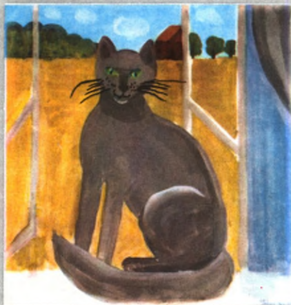
ТЕТЯПОВА Полина, 8 лет.

Ребята! На этой странице мы продолжаем публиковать рассказы ребят, присланные на наш конкурс.