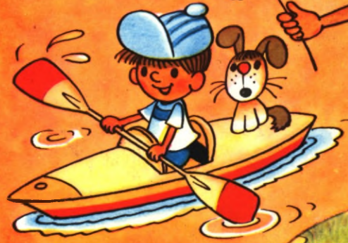
Иллюстрация А. Васильев