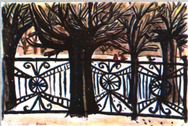
БЕЛКИНА Жанна, 9 лет.