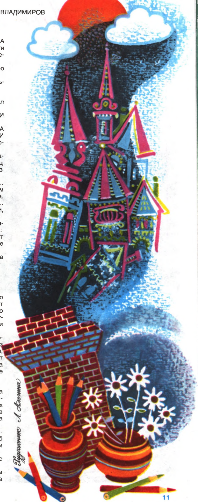
Иллюстрация А. Антима

Теперь он висит в детском саду на самом видном месте. А называется так, как с самого начала придумали ребята: «Воздушные замки».