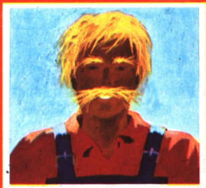
Изображение А. Саватурски

Пшеничного цвета у брата усы. Узнал я, что это не ради красоты. Пшеничного цвета и брови, ресницы — Ну, что за неделю могло с ним случиться? И волосы тоже пшеничного цвета, Наверно, есть тайна какая-то в этом. А брат улыбнулся и тихо сказал: — Я просто пшеницу в полях убирал.