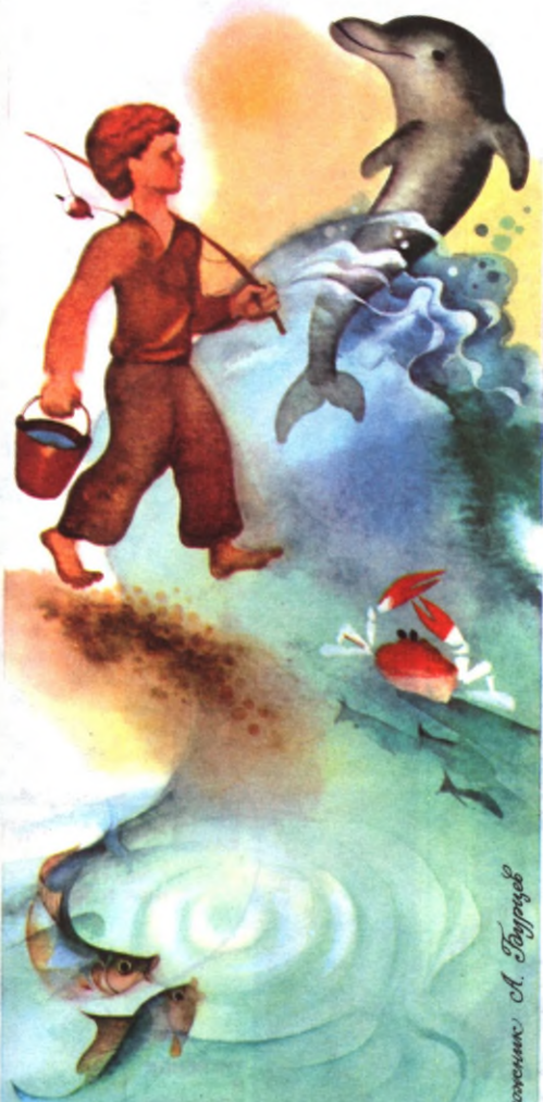
Иллюстрация А. Буряков