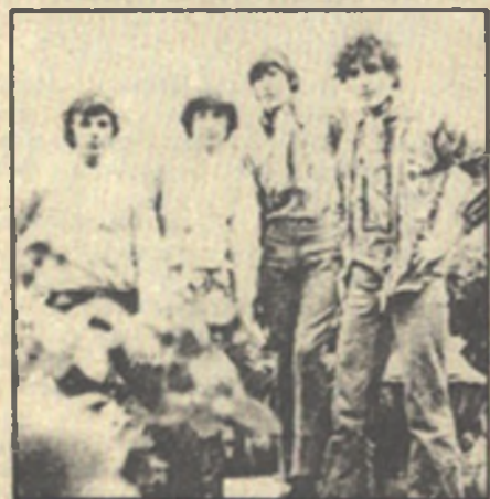
ПИНК ФЛОЙД, 1967 г.