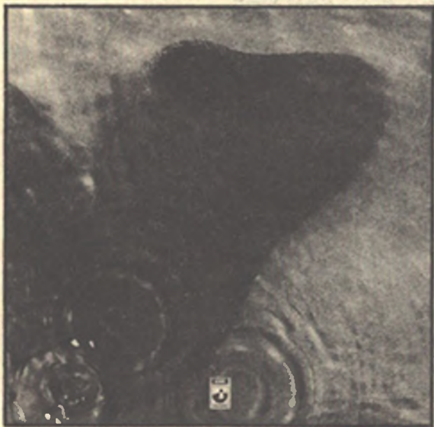
Концерт альбома Meddle , 1971 г.