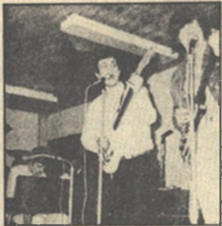
Сид Баррет и Роджер Уотерс, 1966 г.