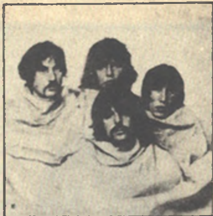
ПИНК ФЛОЙД с Дэвидом Гилмором, 1968 г.