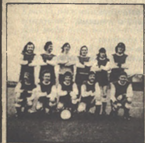
ПИНК ФЛОЙД, 1972 г.