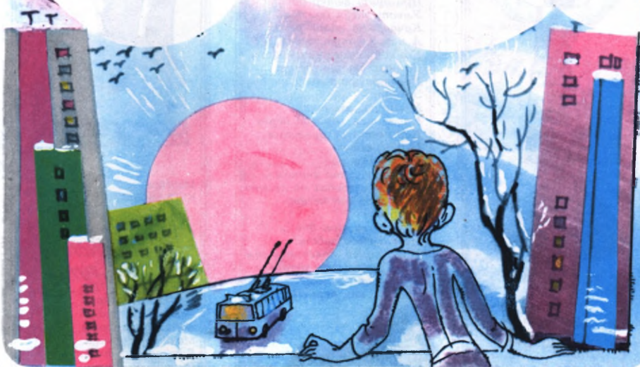
Иллюстрация С. Иванова

С частье родилось рано-рано, когда ещё почти никто не встал. Родилось и ждало своего часа.