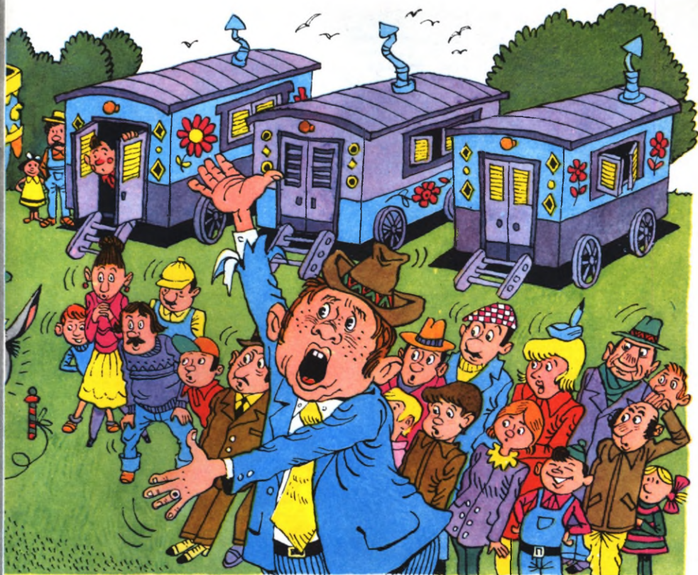
Иллюстрация В. Филантинян

«Знаток» подходил к ослу, обнимал его за шею и говорил сочувственно: