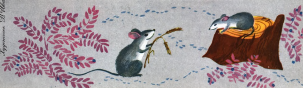
Иллюстрация В. Иванова