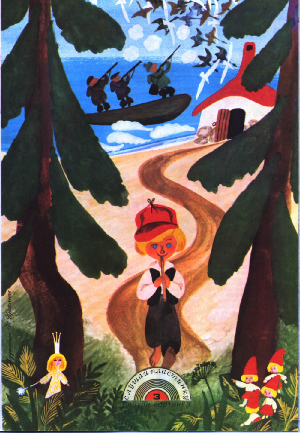
Иллюстрация Н. Уралович