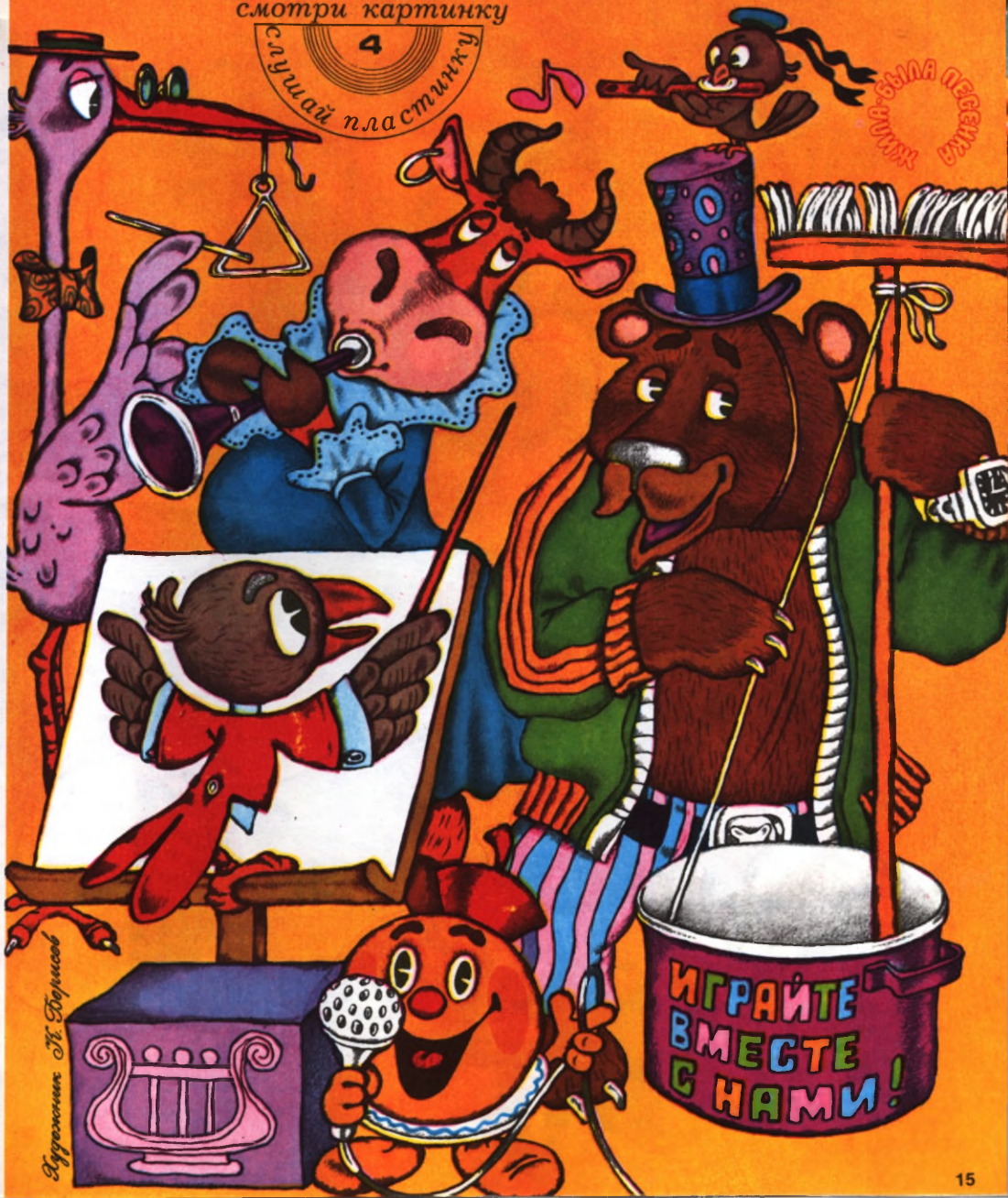
Иллюстрация М. Борисов