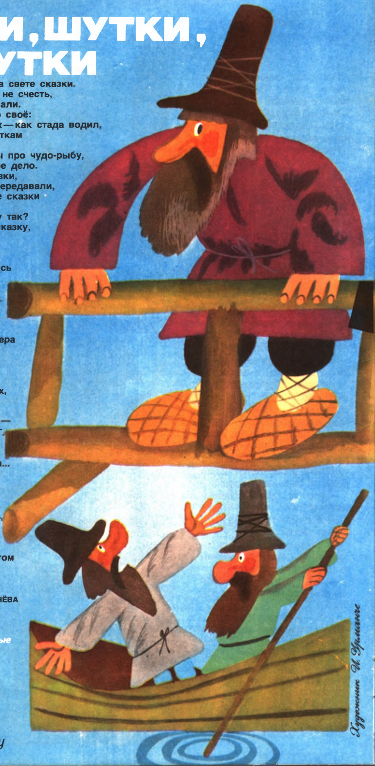
Иллюстрация И. Ширяевой