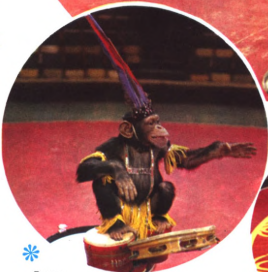
* «Вождь индейцев» — шимпанзе Отелло.