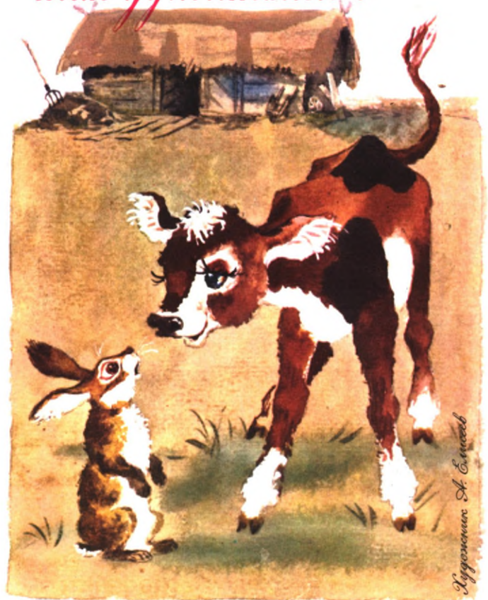
Иллюстрация А. Савиной