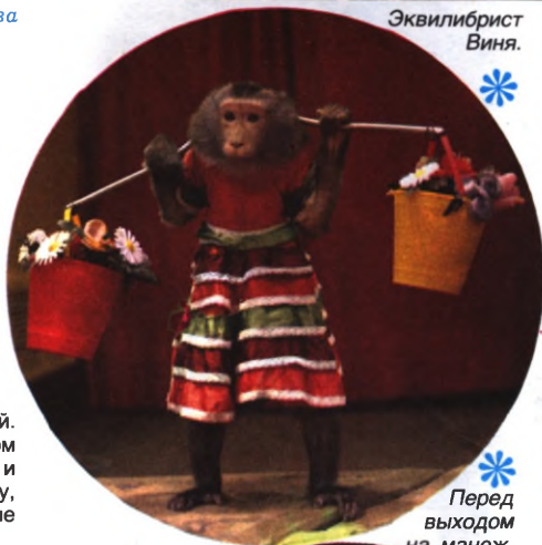
Перед выходом на манеж.

Во время гастролей в одной из стран медвежий цирк разместили рядом с кафе-кондитерской. Каждое утро там пекли пирожные, сладкие булочки, и вкусный запах доносился до медведей. Как уж мишка выбрался из клетки, до сих пор никто понять не может. Учувя вкусный запах, он важно прошествовал в кафе, подошёл к столу, на котором лежали сладости, и, довольно урча, начал завтракать. Покончив с завтраком, он вежливо поблагодарил онемевшего от неожиданности хозяина кафе и так же важно удалился. Ещё долго потом шли разговоры о вежливости и воспитанности четвероногого артиста, но двери кафе закрывали плотно.