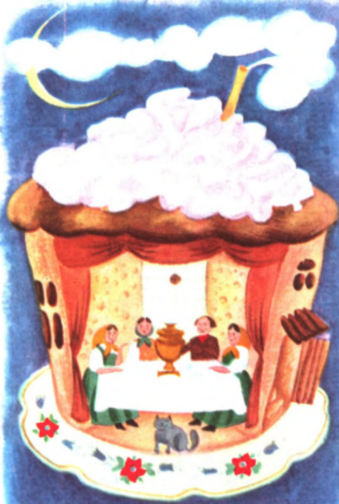
Иллюстрация: В. Мещеряков