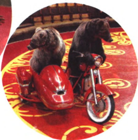
* Ехали медведи на... мотоцикле.