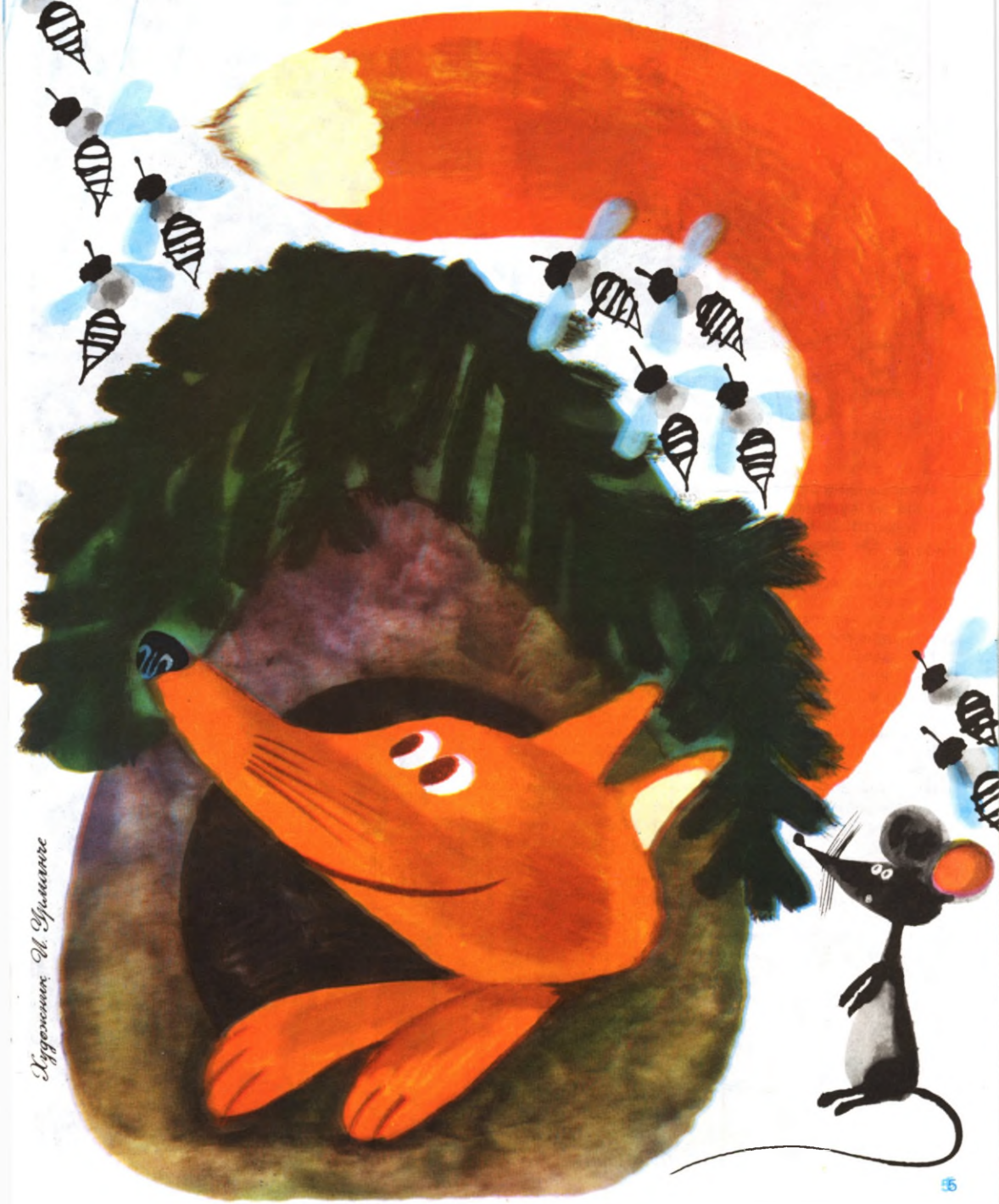
Иллюстрация М. Урманче