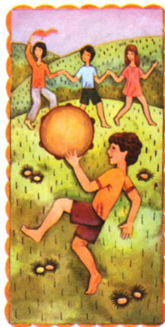
Иллюстрация В. Александров