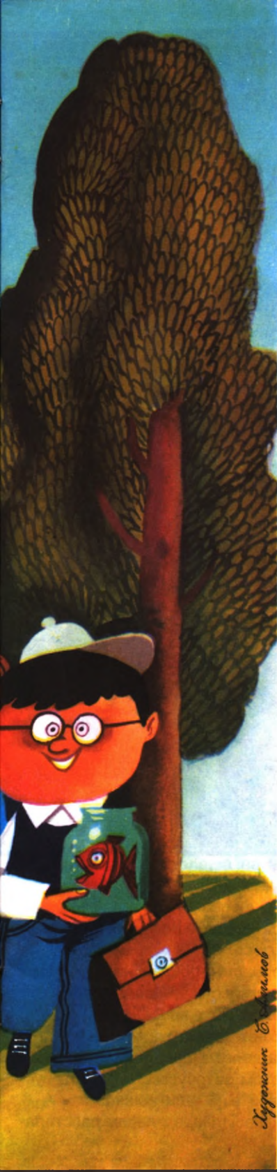
Иллюстрация С. Михалков