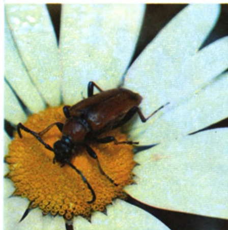
УСАЧ ЛЕПТУРА РЫЖАЯ