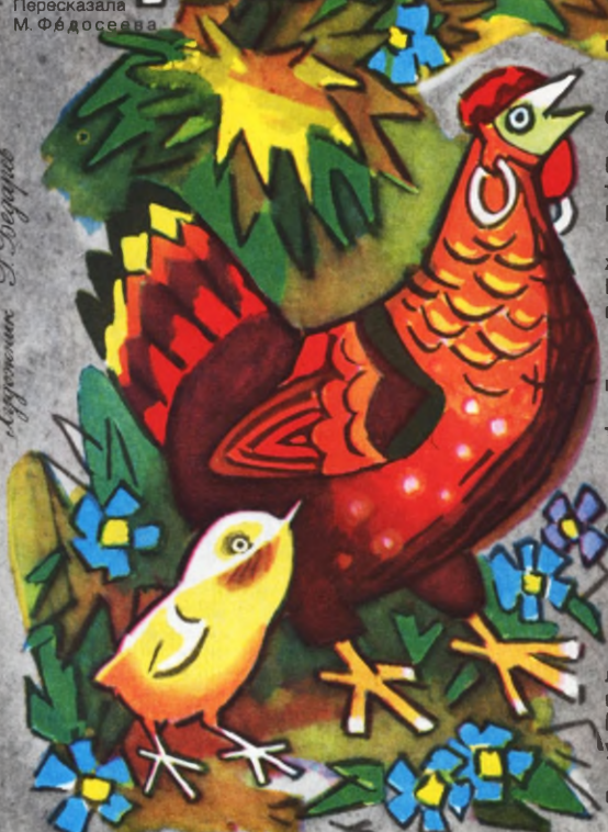
Иллюстрация И. Сидорова

Так что Курица ушла с кухни целой и невредимой, а позади неё гордо вышагивал Цыплёнок.