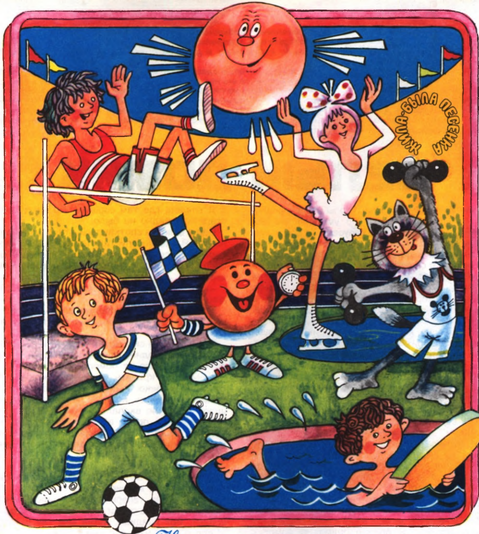
Иллюстрация В. Буланцев