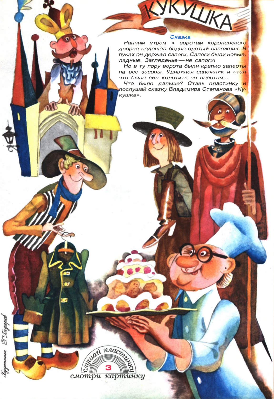
Иллюстрация В. Федоренко

Что было дальше? Ставь пластинку и послушай сказку Владимира Степанова «Кукушка».