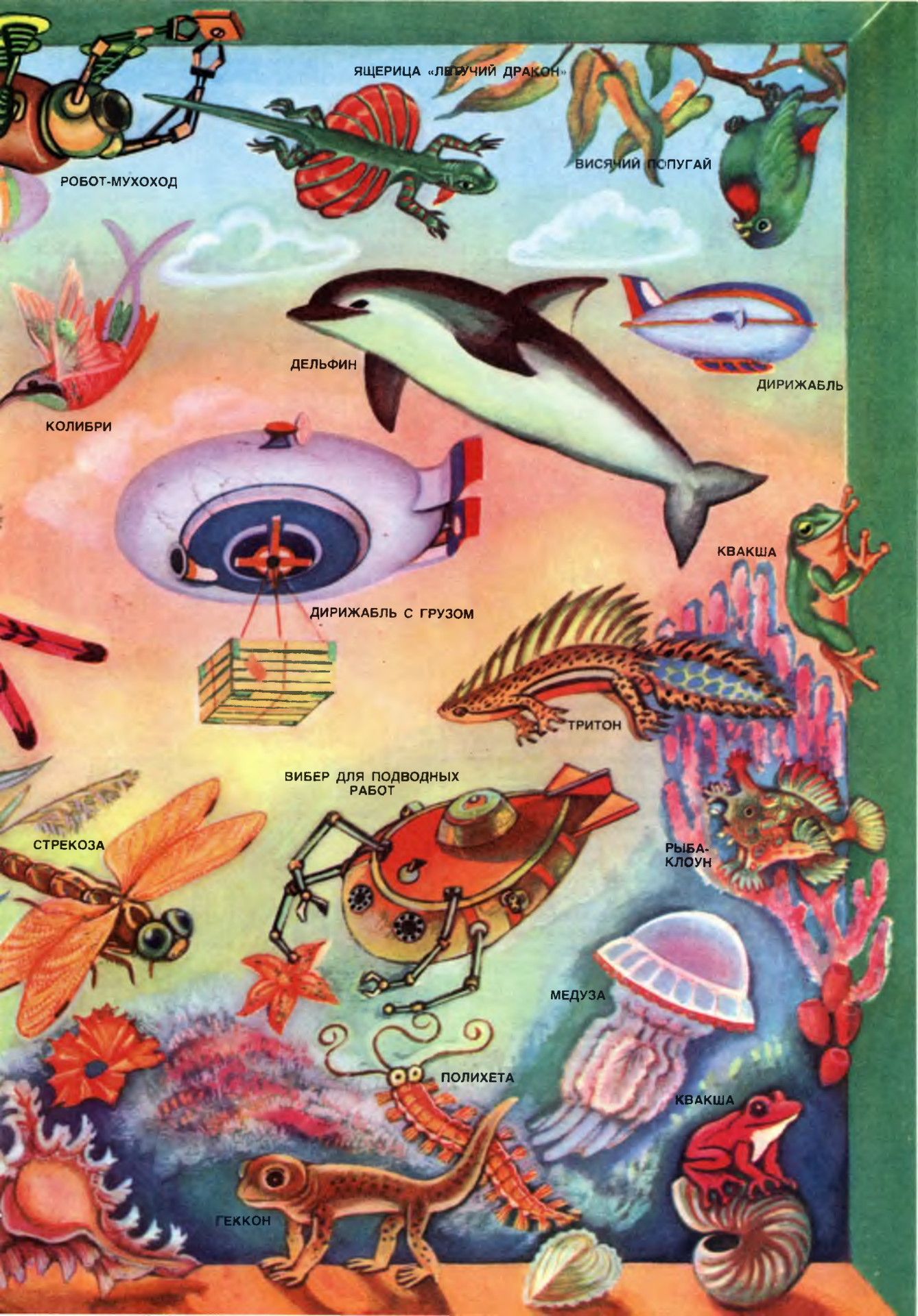
ЯЩЕРИЦА «ЛЯТУЧИЙ ДРАКОН»