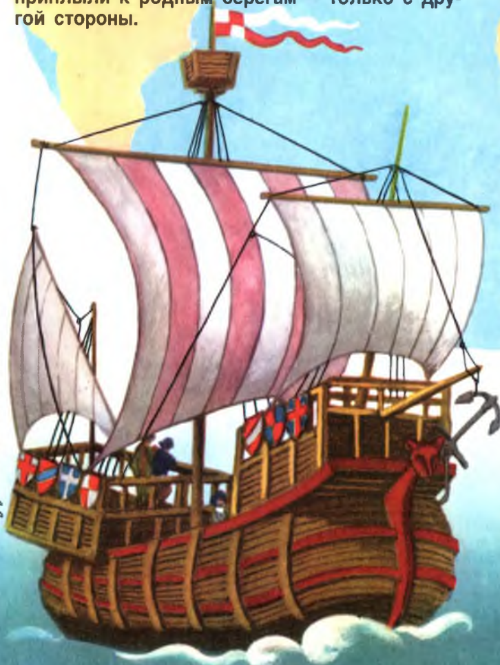
Иллюстрация В. Семёнов

Теперь я задам вам трудный вопрос, поэтому вам потребуется и помощь родителей: как вы думаете, почему на нашей планете есть такие места, где всегда жарко — и зимой и летом?