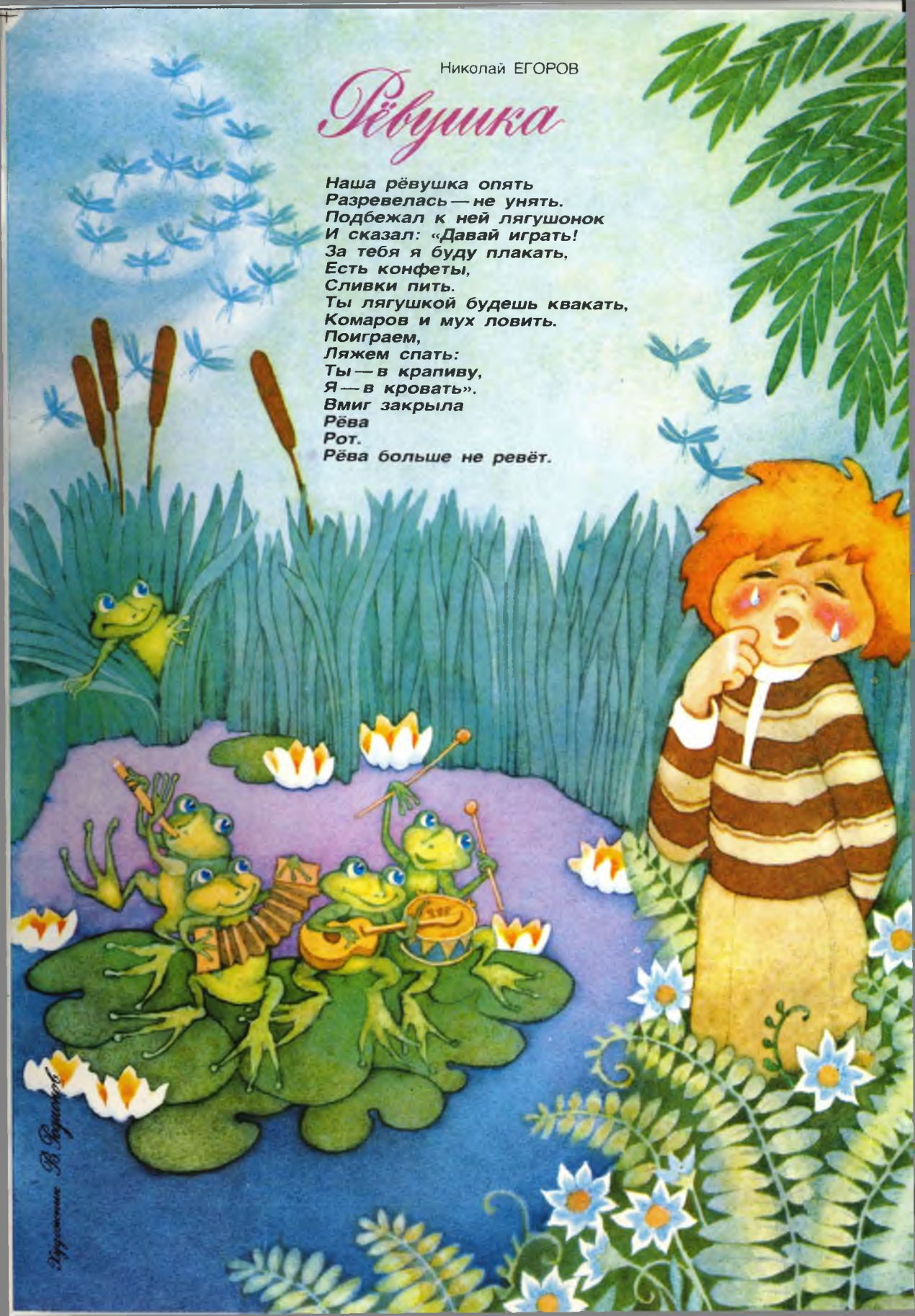
Иллюстрация В. Водкина

Наша рёвушка опять Разревелась — не унять. Подбежал к ней лягушонок И сказал: «Давай играть! За тебя я буду плакать, Есть конфеты, Сливки пить. Ты лягушкой будешь квакать, Комаров и мух ловить. Поиграем, Ляжем спать: Ты — в крапиву, Я — в кровать». Вмиг закрыла Рёва Рот. Рёва больше не ревет.