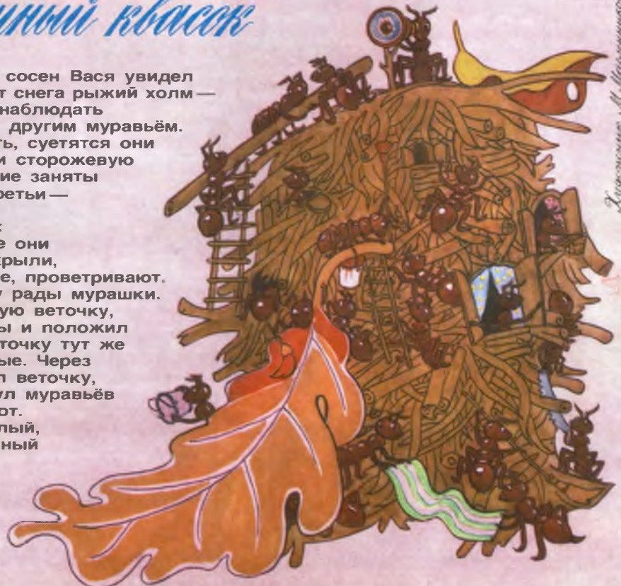
Иллюстрация М. Мельникова

В просвете между сосен Вася увидел освободившийся от снега рыжий холм — муравейник. Стал наблюдать то за одним, то за другим муравьём. Много их. И, видать, суетятся они не без толку. Одни сторожевую охрану несут, другие заняты строительством, третьи — бойцы-охранники. Дед Фёдор сказал: — Сейчас по весне они входы-выходы открыли, сушат своё жилище, проветривают. Вон как солнышку рады мурашки. Он сломал ольховую веточку, очистил её от коры и положил на муравейник. Веточку тут же облепили насекомые. Через минуту дед поднял веточку, осторожно стряхнул муравьёв и взял прутик в рот. — До чего же кислый, бодрящий муравьиный квасок! Усталости как не бывало! На, попробуй. Весну почувствуешь.