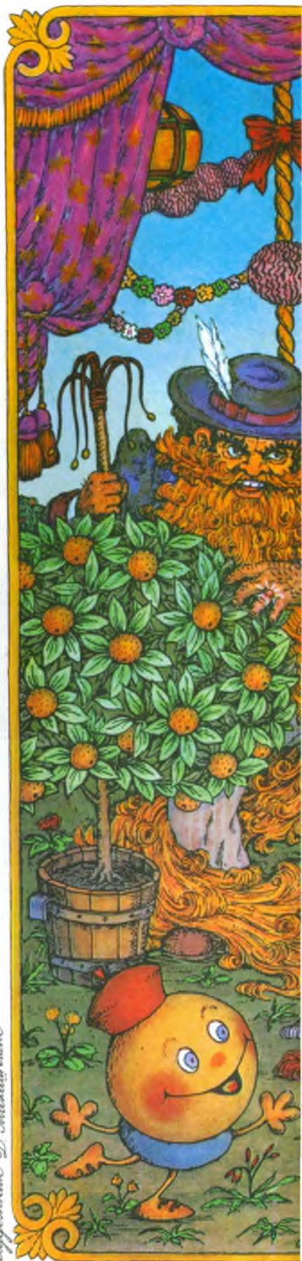
Иллюстрация Д. Малецкого