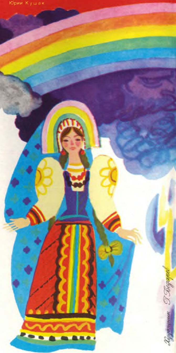
Иллюстрация Т. Богданов

Билась-билась об облака красавица Радуга, просила, умоляла матушку Тучу и батюшку Грома дать согласие на свадьбу. Просило за дочь и яснолицое Солнце, но и оно не смогло смягчить