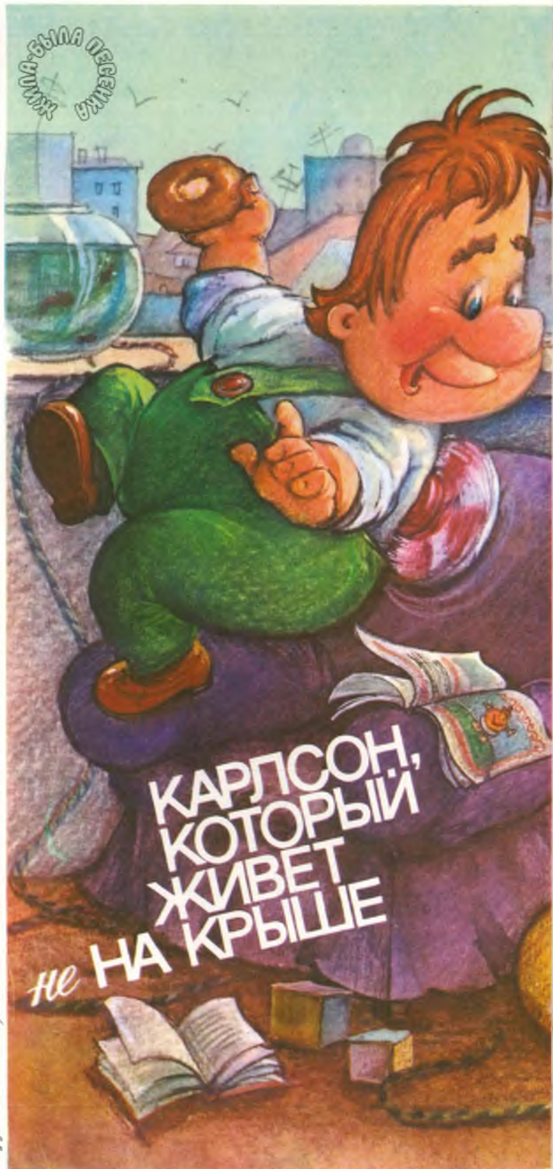
Иллюстрация: С. Воронцов