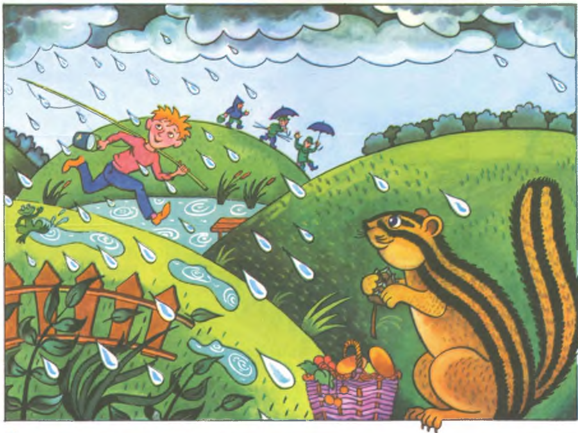
Иллюстрация: С. Писарев

С той поры живой барометр, которого я прозвал «Тук-Тукич», не раз меня предупреждал: «Сегодня на рыбалку ходить нельзя — дождь будет». А однажды я его не послушался и... весь до ниточки промок!