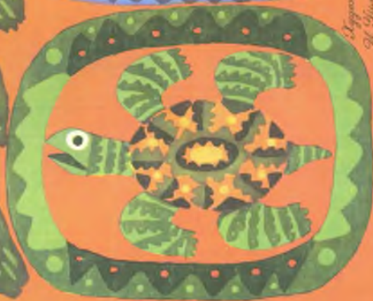
Illustration of S. J. S. J.