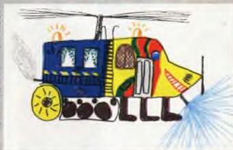
Рисунок Петры КОНВАЛИНКОВОЙ