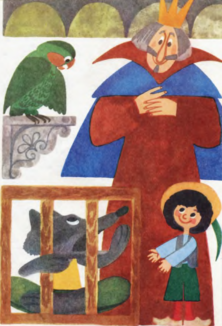
Illustrazione: M. Spadaro