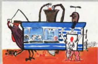
Рисунок Давида ВИТЕКА