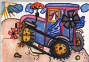
Рисунок Павла ЕЖЕКА