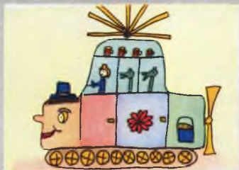
Рисунок Ярославы ИРАКОВОЙ

ФАНТАЗЕРЫ! ПОМОГИТЕ МАСТЕРУ-АРХИТЕКТОРУ. НАРИСУЙТЕ ЗАМКИ ДЛЯ ВОЛШЕБНИКОВ.