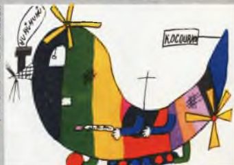
Рисунок Симони ЧЕРВЕНКОВОЙ