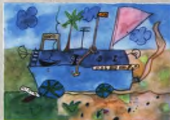
Рисунок Кашки СОУЧКОВОЙ