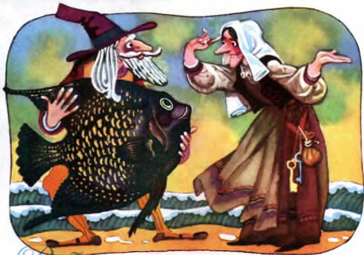
Иллюстрация Е. В. Бурдукова