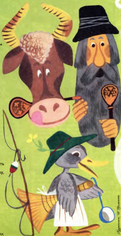
Иллюстрация Ю. Кушак