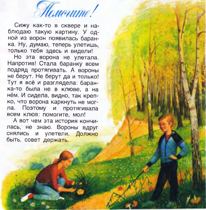
Иллюстрация М. Мамбеев

А вот чем эта история кончилась, не знаю. Вороны вдруг снялись и улетели. Должно быть, совет держать.