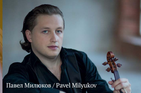
Павел Милюков / Pavel Milyukov