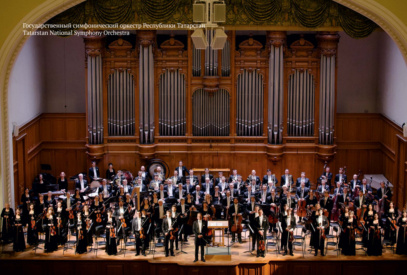
Государственный симфонический оркестр Республики Татарстан Tatarstan National Symphony Orchestra