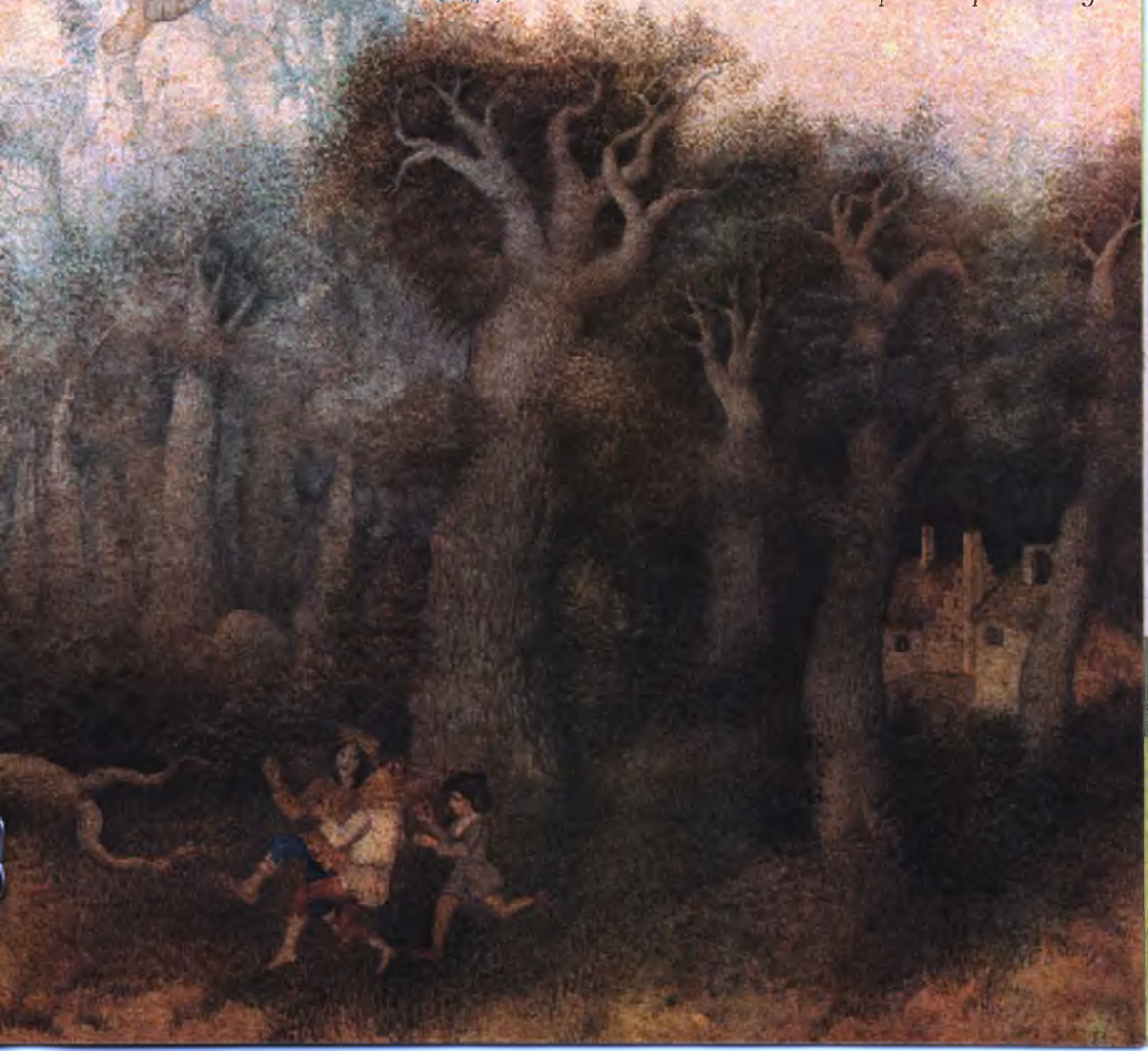
Иллюстрация Е. Савиной