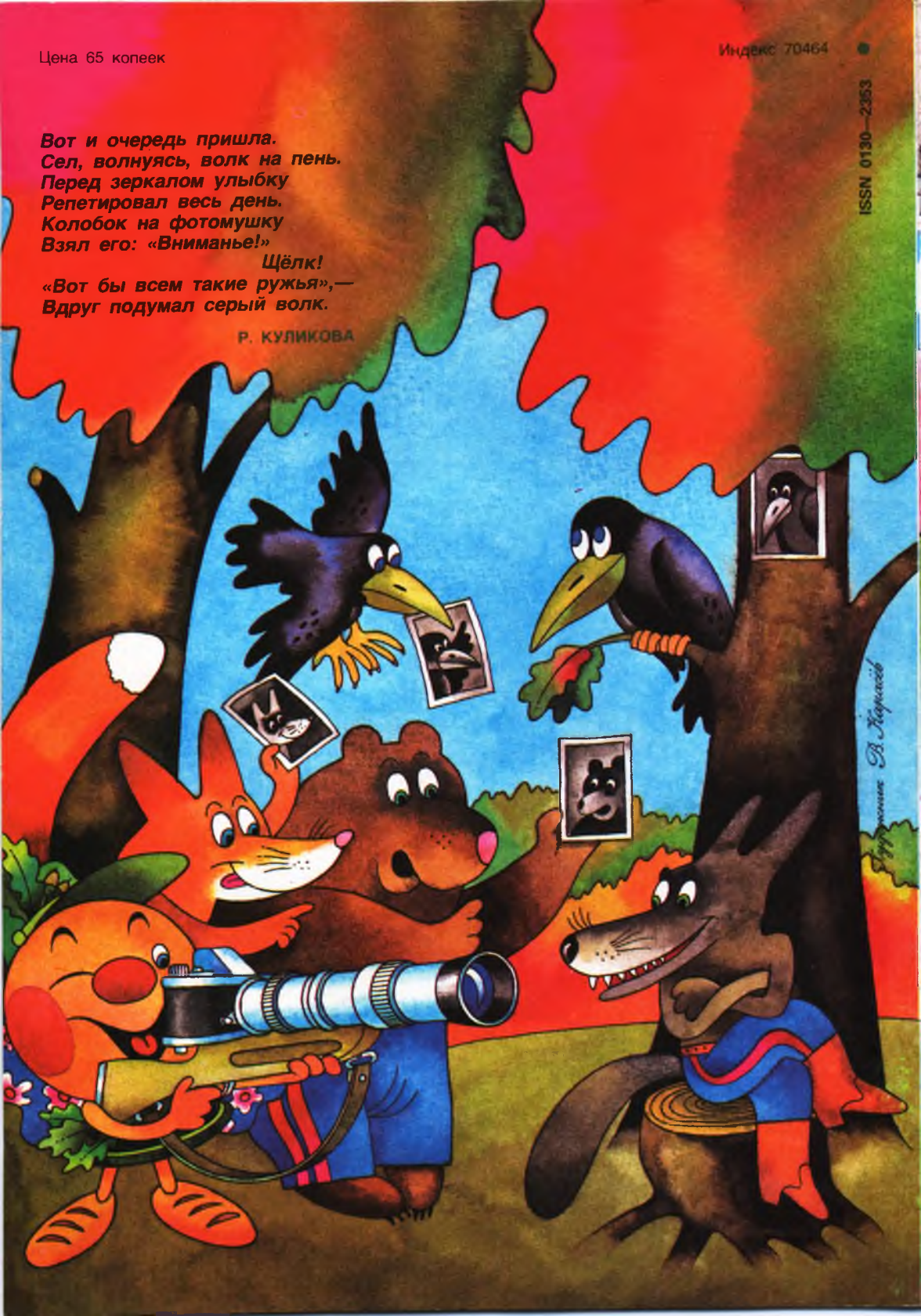
Иллюстрация Р. Куликова