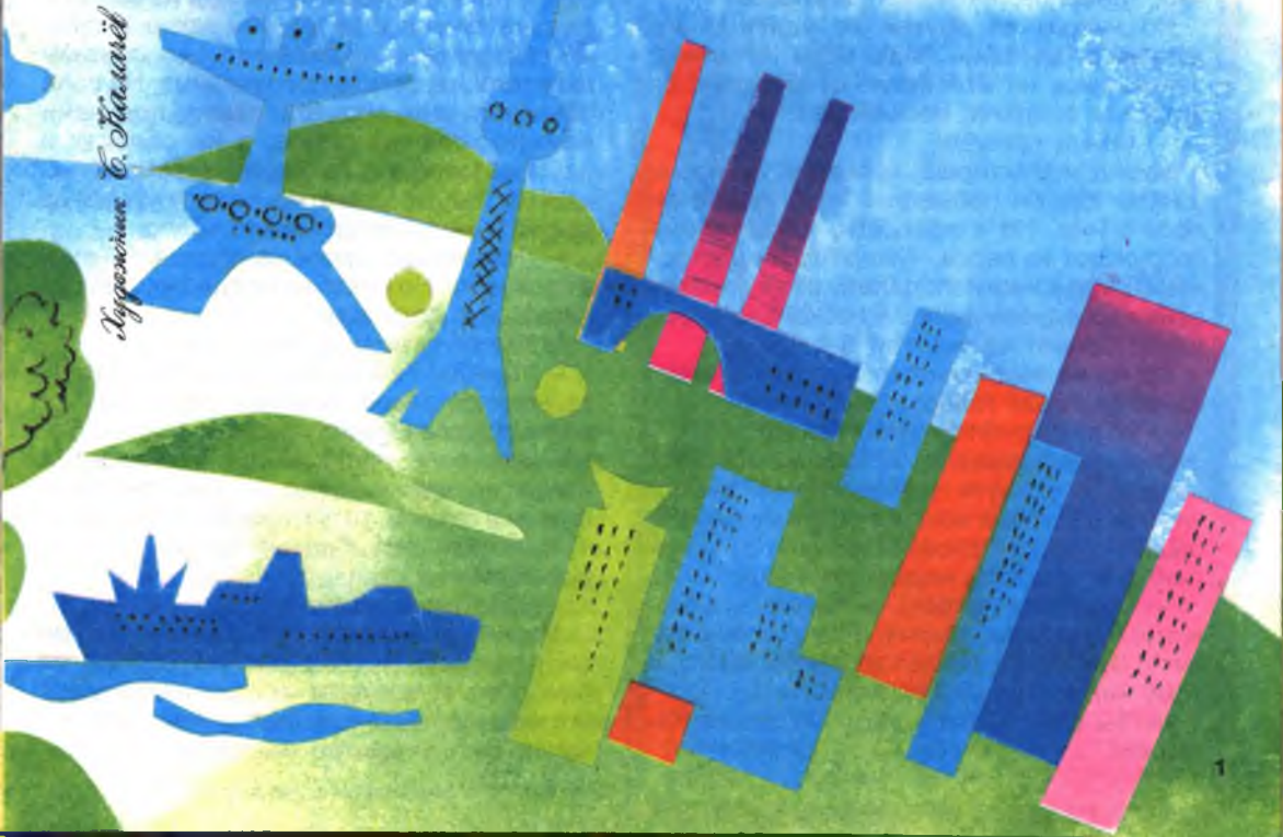
Иллюстрация С. Лазуркин