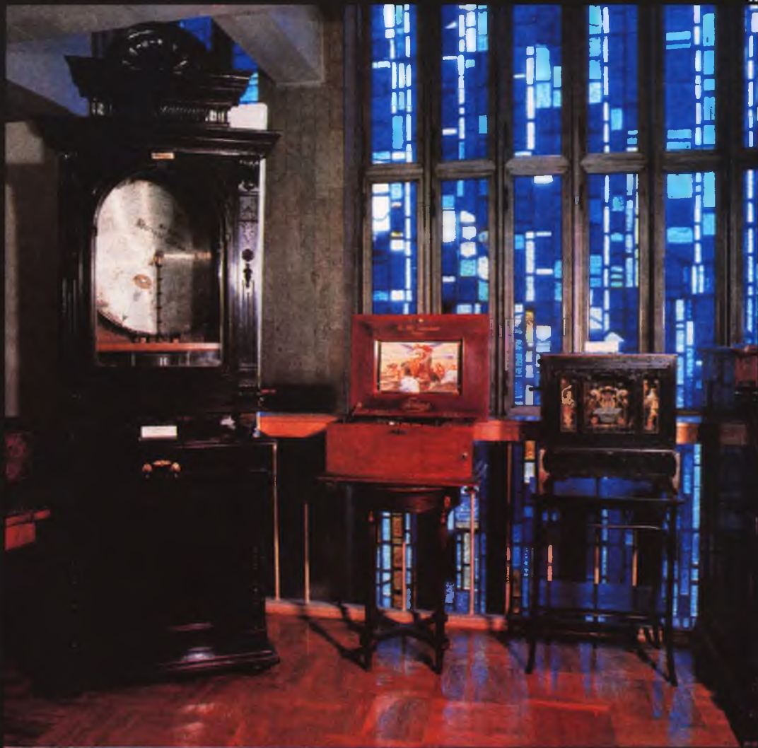
4. Музыкальные ящики. От них потом пошли граммофоны и патефоны. У музыкального ящика сбоку ручка для завода механизма. В центре — большой металлический диск с дырочками. Вращаясь, он зацепляется за металлические гребешки, и тогда звучит музыка.