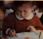
А. Островский, Дарственный архив Алфредо Бибистрато