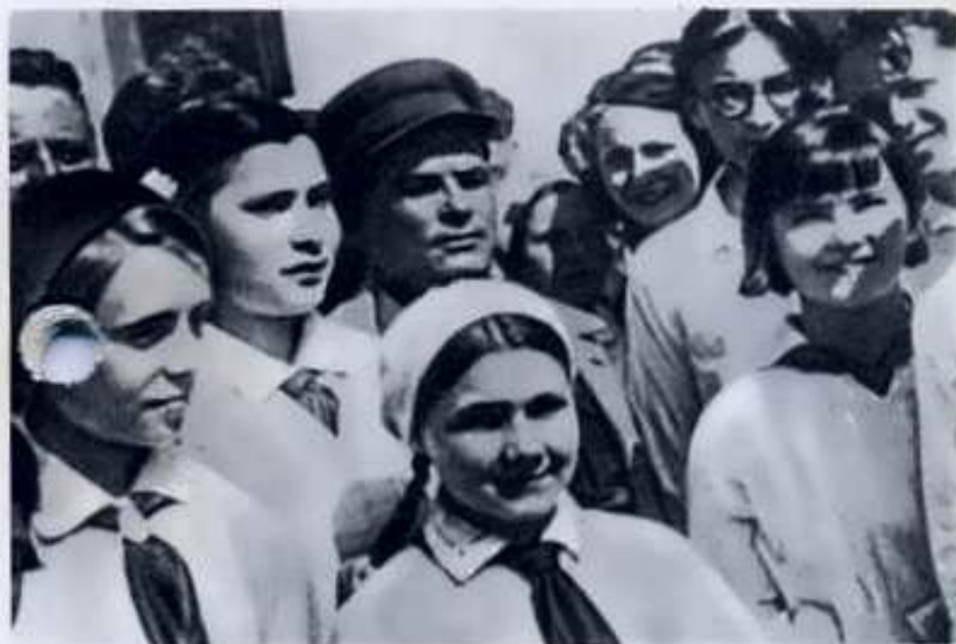
Сергей Миронович Киров среди ленинградских пионеров. 1934 год.