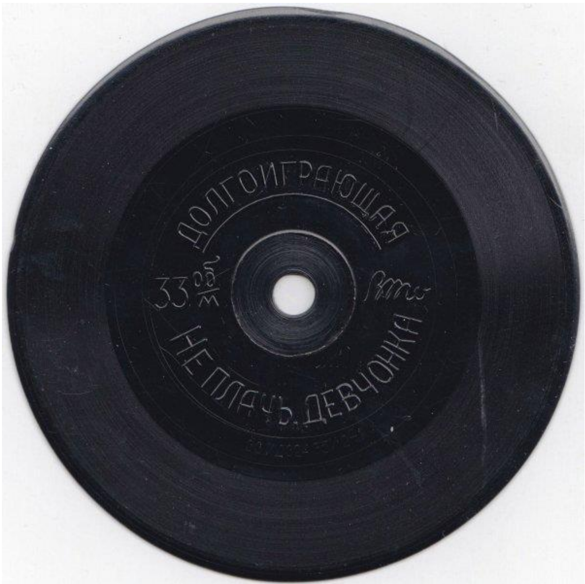
Грампластинка долгоиграющая с записью старинной песни «Не плачь, девчонка» промышленно изготовлена на Театральной фабрике ВТО в городе Долгопрудный Московской области. Диск малого диаметра. Датой изготовления стал отрезок времени с 1951 по 1984 год. Оптимальная вращательная скорость грампластинки равна 33 оборотам в минуту.