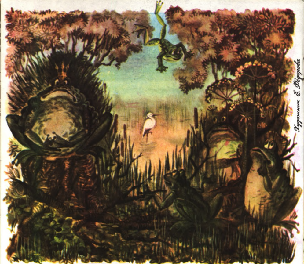
Иллюстрация Е. Вигоринской