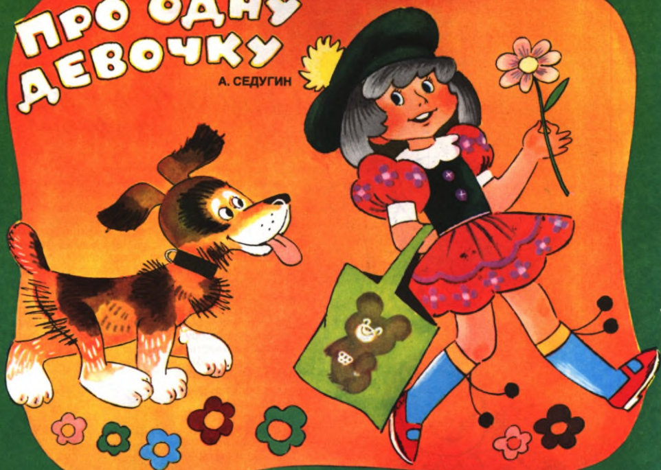
Иллюстрация Т. Богарнев