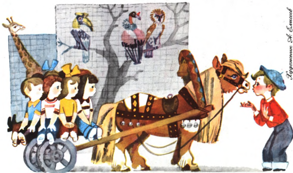
Иллюстрация А. Савиной

...Бежит конёк, да так весело и споро, что не только ребятишкам, но и Саше радостно стало.