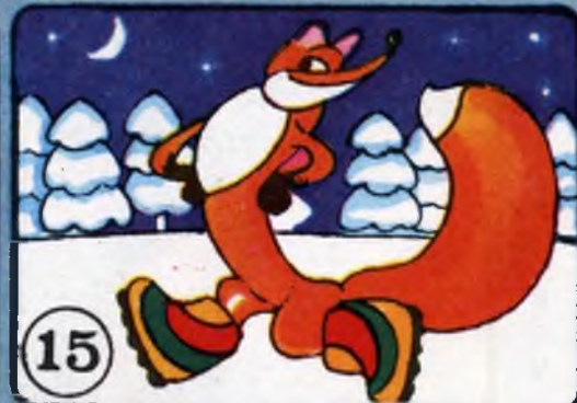
Лиса — пару детских сапожек, чтобы охотничьи собаки приняли её следы за человеческие.