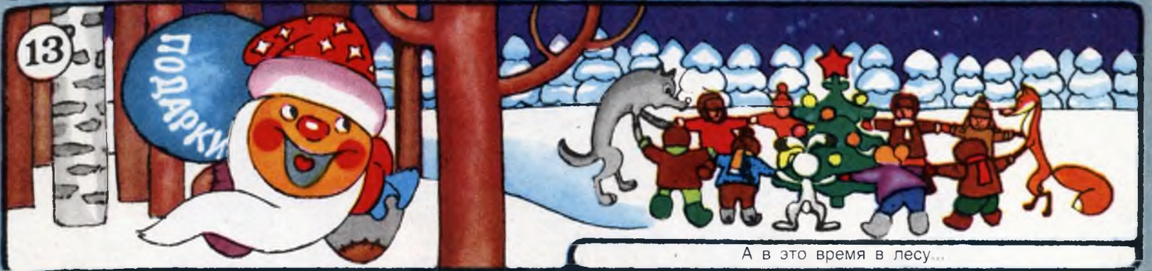
А в это время в лесу...