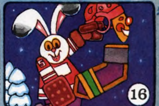
А зайца уже никто не назовет трусишкой. Ведь всем известно, что «трус не играет в хоккей!»